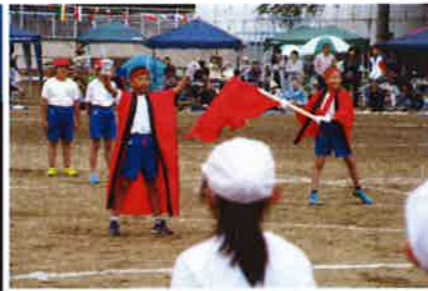
元気いっぱいの応援合戦