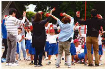
ダンスも楽しい チェッコリ玉入れ（1・2年）