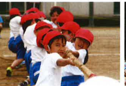
負けるな！負けるな！ 紅白対抗綱引き