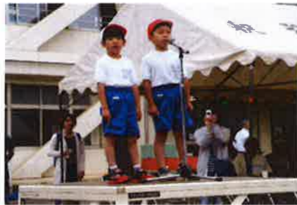
1年生による開式のことば