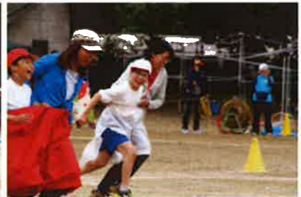
息もぴったり！ デカパンリレー（3・4年）