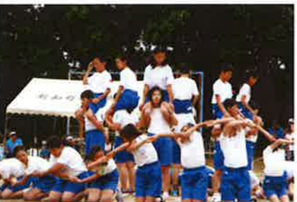
力強い集団美 組体操（5・6年）