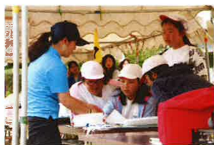
係の仕事も一生懸命 得点係