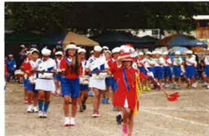
運動会の華 鼓笛パレード（4・5・6年）